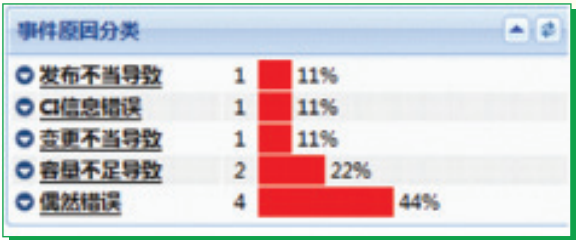
图四：事件原因分类报表